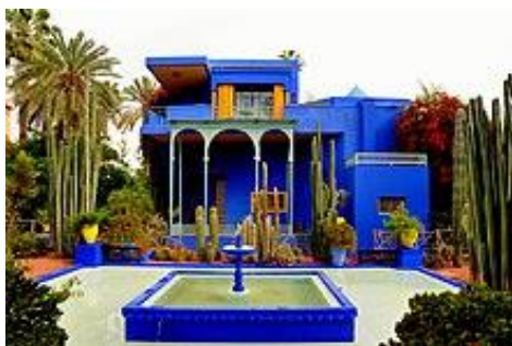
Le jardin de Majorelle

Parvenu au faîte de la gloire, ce travailleur acharné, passionné mais tourmenté se trouve contraint de faire ses adieux pour raisons de santé en janvier 2002. PLUTON finissait de transiter JUPITER culminant tandis que NEPTUNE s'opposait au SOLEIL Lion. Saint-Laurent passe les dernières années qu'il lui reste à vivre, reclus au 55 rue de Babylone, avant de s'éteindre six ans plus tard. « Les plus beaux paradis sont ceux qu'on a perdus ». C'est sur cette phrase de Proust que le couturier avait annoncé son dernier défilé.